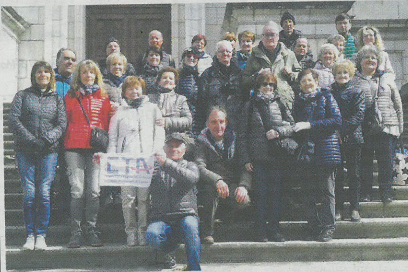
Soci CtAcli in viaggio nella storica regione della Savoia.

Piazza Virginio 13, Cuneo - tel. 0171-452611 - email: info@ctacuneo.it